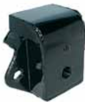
D-100 Soporte Tras. D-100 64/65 C/Motor Valiant (2489388)