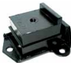
Soporte de Motor Pick-Up Chevrolet D-20 (Diesel) (94647865)