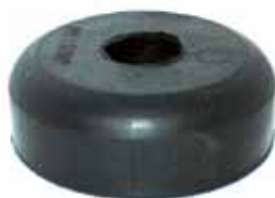
Soporte Delantero Inferior Pick Up (CITT6A061C)