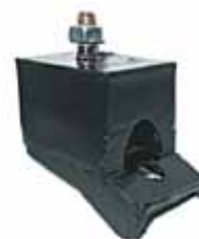
600 Soporte de Caja (870286)