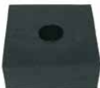
Asiento Carrocería Intermedio