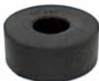
Soporte Superior de Carrocería F-100 (C07PZ8100154)