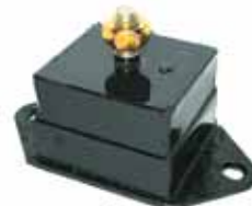
TRAFIC Soporte Delantero Motor 2000 y Diesel (770697879)