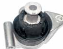
ARTICULO IMPORTADO Sop Trasero de Motor Astra 2.0 / 2.2 / 2.4 (905385829)