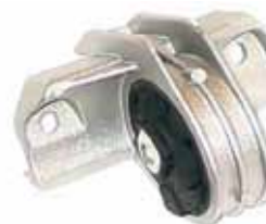
R 19 Soporte Central Motor Clio - Megane - R-19 (7700804163)