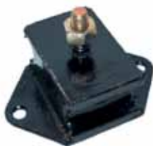
403 Soporte Delantero 403 (180708) (180713)