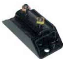
Sop. Caja De Velocidades F100 con Motor MWM Diesel Naftero 4.2 6068-AA