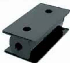
Almohadilla Sup. Soporte Radiador Camión (3897666)