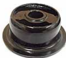
Soporte Trasero de Cabina Ford Cargo Año 1996 en adelante (TJG899397)