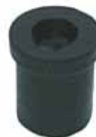
Buje de Elástico