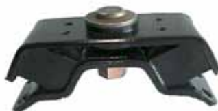
Soporte de Caja Hilux 4x4 (12371-54060)