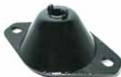
TRAFIC Soporte Caja de 5 Velocidades Trafic Naftero y Diesel (7700702890)