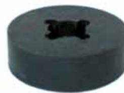
Soporte Inferior de Carrocería F-100 (CGTZ8100154)