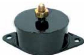
Sop. Motor Falcon 2,3 4 Cil. y Taunus 1982 en Adelante (BAE20Z6038A)