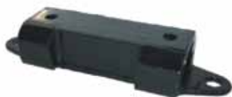
ESTANCIERA Soporte de Caja Orig. (Cocodrilo) (734969)