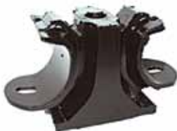
Soporte Trasero de Motor (Lado Caja de Veloc.) Mod. F-100, F-150 y F-14000 (FT71199381) (79TU6068B)