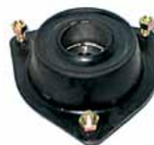
1500 Cazoleta de Amortiguador con Rulemán (712445535)