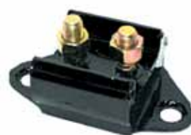
JEEP IKA Soporte Trasero 1963 (3166936)