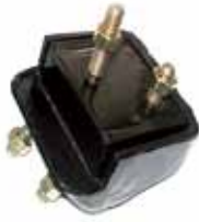
Soporte de Motor lado Derecho F100 Motor Cummins Diesel