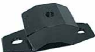
Soporte Delantero Caburé P-63 Original (P6310200)