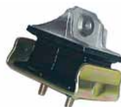
SPRINTER Soporte Motor Delantero (6902427113)