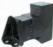
Amortiguador de Vibración Caja Izquierdo Diesel Todos - Bajo (9991041)