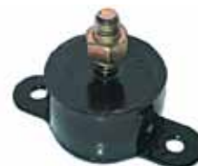
Soporte Delantero Borgward