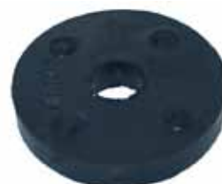
403 / 404 Manchón de Dirección 403/404 (404003)