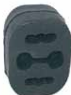
DUNA / UNO Soporte Caño de Escape