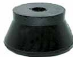
Soporte Delantero Superior Pick Up (CITT6068B) (C3TZ6068D)