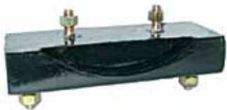
C-350 Soporte Delantero 57/76 (6327727)