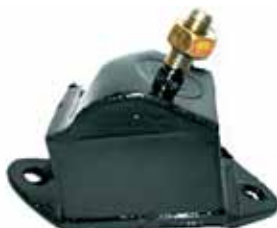
R 9 / R 11 Sop. Del. Izq. Caja Veloc. (7704001320)