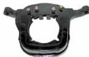
Soporte Tras. Motor Caja 5° Naftero Mod. 90 en Adel.- Fund. Nodular (1843-700)