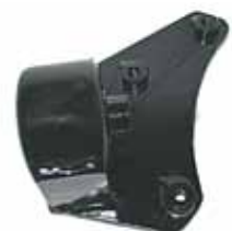
147 FIORINO Soporte de Motor Der. (1481625)