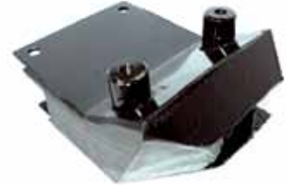
321 Soporte Chasis Izquierdo