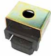
Juego Completo Soporte Cabina (Bajo Radiador) Mod. F-100 y F-7000 Años 1968/80 (CITB-8A320-AX)