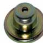
R 19 Cazoleta Metálica Amortiguador Delantero Express (7700308789)