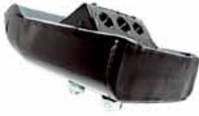
321 / 1114 Soporte del. Y Tras. 3 Agujeros (3212200217)