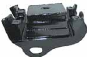
CHEVY Soporte Motor Delantero (3866247)