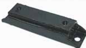
Soporte Trasero (Rd1102000)