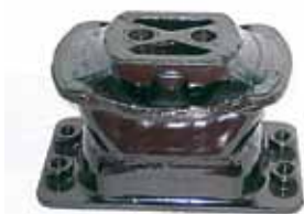
1517 Soporte Trasero Motor H.P.N. (392.240.7018)