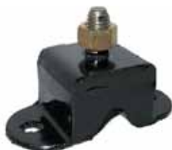
JEEP IKA Soporte Delantero Original Bajo (638629)