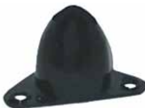
Tope Rebote Amortiguador Elástico (909022)