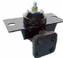
Soporte Trasero Reforma