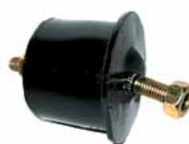
R 18 Soporte Del. Motor 2000 Fuego Diesel (7704000767)