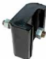
Soporte Trasero Perkins. D 100, D 400, D 500 (2230368)