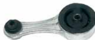
R 19 Soporte Sup. Lado Caja Express Diesel - Clio - R-19 (Recto de 50 mm)