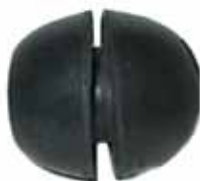
1500 Buje Tensor Juego Mach./Hemb. (4125492)