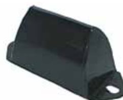
ESTANCIERA Taco Suspensión Del. (2005291)