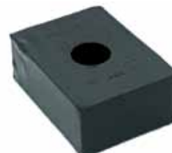
Almohadilla Montaje Carroc. Camión 66 en Adel. C-50/60/70