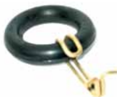
R 18 Soporte Caño Escape R-18