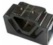
Soporte Trasero de Motor Scania 110 y 111