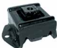
JEEP IKA Soporte Trasero 1962 (3136058)