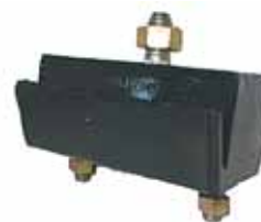
Soporte Del. Derecho Valiant (2264140)