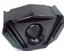
Soporte Trasero de Motor F14000 Año 1999 en adelante