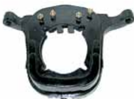
Soporte Tras. Motor S 80 Naftero Fundición Nodular (1843-631)