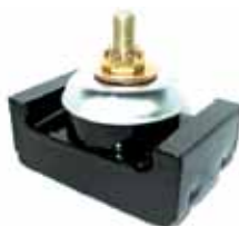
Soporte Tras. Conj. Armado Ford C/ Perkins F 350 y F 600 años 1964/68, F 250, F 700 y F 7000 (CITT6068C) Deutz (03072046)