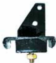
DAUPHINE Y GORDINI Soporte Trasero (8235470)