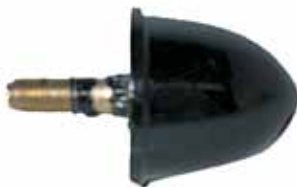
Tope Rebote Delantero con Motor Perkins (2928433)