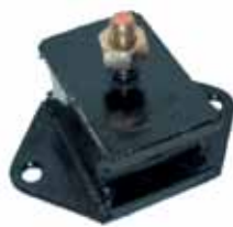
404 Soporte Delantero 404 (180708)(180713)