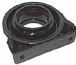
1600 / 125 Soporte de Cardán (4289600)