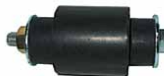
ESTANCIERA Soporte Delantero Reforma (2091268)