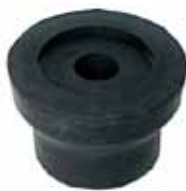
Soporte Int. Cabina Camión y D-100 (1563193)