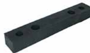
ESTANCIERA Goma de Repuesto para Art. 801 (2004823)