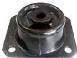
Soporte Motor Puma DZ 1013 (Lado Ciguenal)