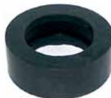
1517 Soporte de Cardán Camión