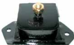
R 12 Soporte Delantero (7700504590)