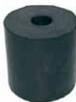
JEEP IKA Buje Grande Repuesto para Art. 812 (2007337)