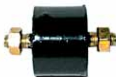
Soporte Caño de Escape Rosca 8 X 1,25 (000250010)