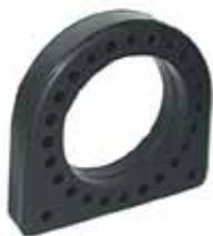
Protector Rul. Cardán 6208 Reforma