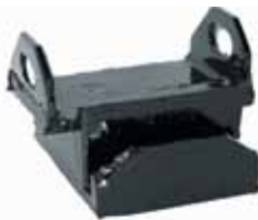
400 Soporte Delantero. (3792404)