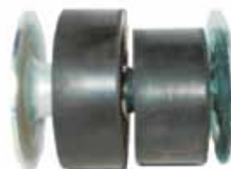
Soporte de Radiador Pick Up 1961/73 (Arm. C/ Chapas) (C5TZ8100154A)