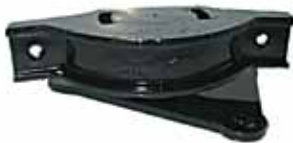
128 / 1300 Soporte de Caja (4218081)