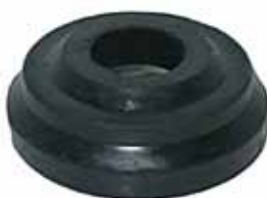
600 Soporte Delantero Superior (8781661A)