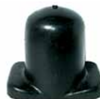
Tope de Elástico Trasero