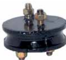
ED 110 Soporte Cabina 64 >> (7131004)