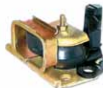
R 19 Soporte de Motor Derecho (No Hidraulico) Clio - Express Diesel (7700805123)