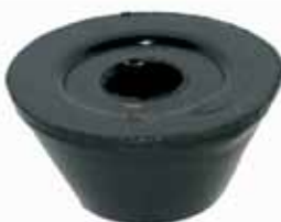
Soporte Cabina Camión (3886729)