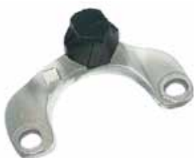
R 19 Tope Soporte Del. Motor Derecho de Aluminio R-19 (Diesel)