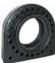
Protector Rulemán 6209 Orig. Mod. 62 (3314120)