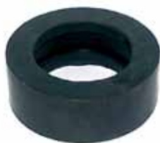
1517 Soporte Cardán (1517/1518)