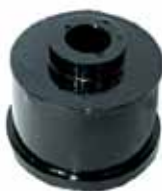
Sop. Superior Cabina Camión y D-100