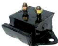
Sop. Motor Del. Dodge con Perkins 70/71 (A003334/1)