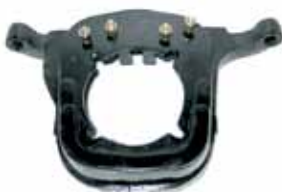
Soporte Tras. Motor Caja 5° Diesel Mod. 90 en Adel. - Fun. Nodular (1843-680)