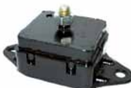
JEEP IKA Soporte Lateral 1963 (3166782)