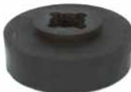
Soporte Inferior de Carroc. 80 mm F-100 (CSPA8100155)