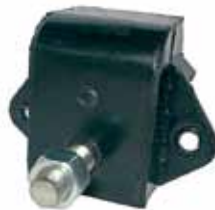
Idem Art. 754, con Bulón (2489388)