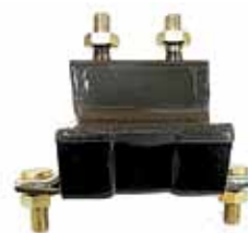
Soporte Caja de Velocidades Transit Diesel (88UB6038AB)