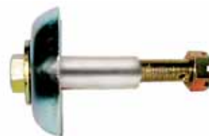
Bulón Comp. Rep. Soporte Armado Ford C/ Perkins