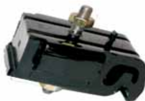
Soporte derecho de Motor Fiesta Naftero y Diesel (6203710)