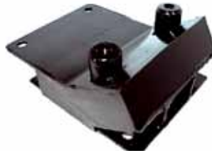
321 Soporte Chasis Derecho