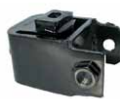
Sop. Tras. Motor Gacel/Pasat (ZBA3991511)