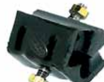
Soporte de Motor Galaxy (823199381) (823199382)