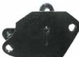
DAUPHINE Y GORDINI Soporte Lat. Izquierdo (8300015)