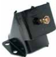
1500 Soporte Delantero (3519205)