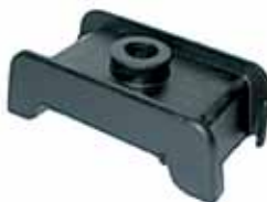
Soporte Aislador Cabina Superior Modelo F 100 (C07PZ8100B0A)