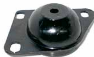
PALIO / SIENA NAFTERO Y DIESEL Soporte Motor lado caja (46444759)