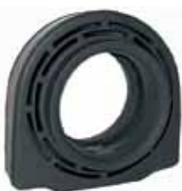
Protector Rulemán Cardan 6209 Orig. Mod. 57