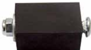
Soporte Radiador de Aceite Mercedes Benz