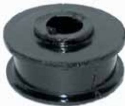
Soporte Sup. De Cabina Pick-Up 67/73 (3889871)