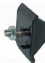
405 Tope Motor Lado Derecho Peugeot 405 (1844170)