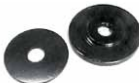
Arandelas de Artículo 20007