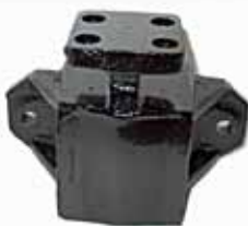
Soporte Trasero Orig. 57