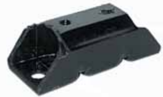
Soporte de Caja Chevrolet 400 Chevy y Pick-up 1962/76 (3792133) (2790968)