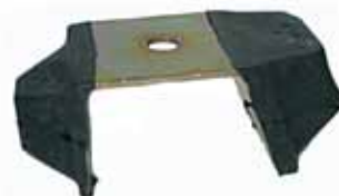
405 Soporte Tope de Motor (Derecho) 405 Diesel - 93 en adelante (9607170880)