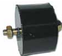
125 Soporte Delantero (4286570)