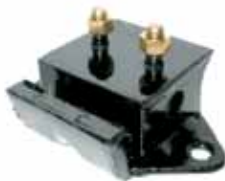
Soporte Lat./Aguj.y 2 Bulónes