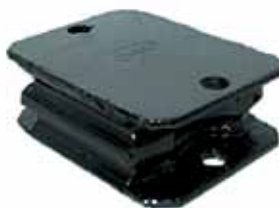
Soporte Delantero Perkins 6 Cil. (BAC7056038A)