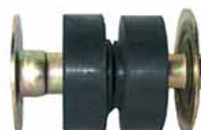
Montante Completo Cabina Del. Mod. 73/81(Trompa) (C7TZ8100155)