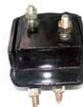
Soporte de motor lado izquierdo F100 Motor Cummins Diesel