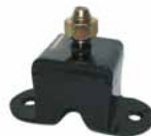
Soporte Delantero Original Alto (638841)