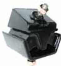
R 18 Soporte de Caja Velocidad R-18 Motor 1400 y 1600 (7704000469)