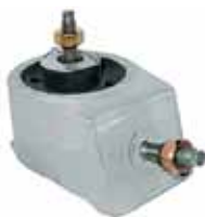
R 21 Soporte de Motor R-21 Lado Der. (7700769720)