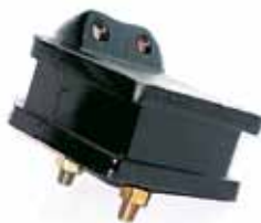
1517 Soporte Trasero Motor (3522400318)