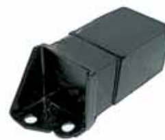
404 / 504 Amortiguador de Vibración Largo Caja Izq. Peugeot 404/405 Diesel Todos (1974010)