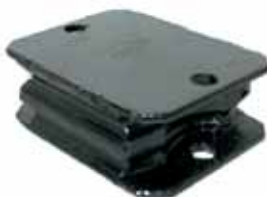
Soporte Del. Perkins 6 Cil. 354, Camiones Ford F 600, F 700, F 7000 y Camiones Dodge (BAC7D5638A)