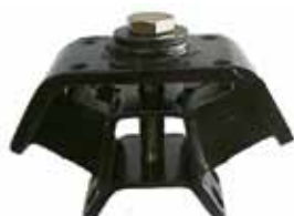
Soporte de Caja Hilux 4x2 (12371-34030)