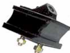
1521 / 1526 Soporte Motor Delantero Izquierdo Derecho (3452400017)