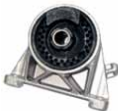
ARTICULO IMPORTADO Soporte de Motor Astra / Corsall / Zafira (90538576)