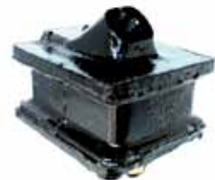
1517 Soporte Delantero Motor (3522400417)