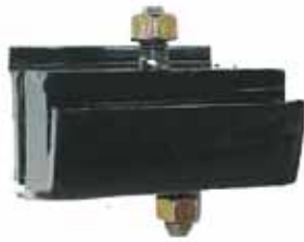
Soporte Del. Izq. Valiant (2265018)