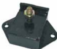
504 / 505 Soporte Delantero 504 Diesel y 505 Naftero (1807250)