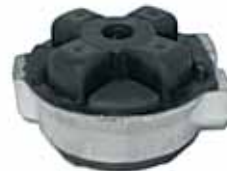
Soporte Caja de 5° VW - Gacel/Carat Gol - Saveiro y Senda (3033991131)