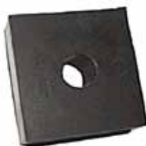
Almohadilla Montaje Carrocería Pick Up Ford F-100 (CITB8100272A)