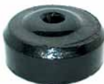
Suplemento Soporte Tras. Ford C/ Perkins (CITT6A061D)