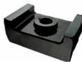
Soporte Trasero Ford C/ Perkins F 350 y F 600 Años 1964/68, F 250, F 700 y F 7000 (CITT6068C) Deutz (03072046)