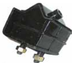
Soporte Delantero Motor F-100 Cummins Turbo 96/98 y Cargo 915 Mwm Diesel (2SB/199201)