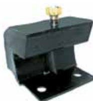
Soporte Delantero Ford F-100 1969/70 (CIMM6038C)