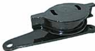
1500 SUPER EUROPA Soporte de Caja S/Rosca (4204386)