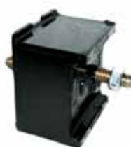
R 18 Soporte Trasero Motor 1400 R12 Caja de 5ta (7704000622)