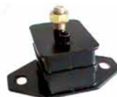
Soporte de Motor Diesel Hilux 2.4/2.8 (12361-5411)