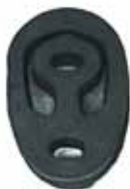
POINTER Soporte Silenciador