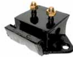
Soporte Lateral C/ Aguj. Perkins Potenciado Y 2 Bulónes (006086)