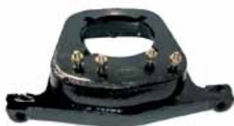
404 / 504 Soporte Caja de Velocidad 404/504 Naftero Fundición Nodular Nro. Orig. 1843-260