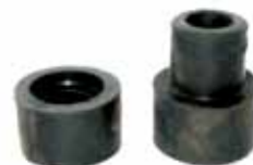
Aislador Tensor Pick Up Ford F-100 1966/69 (C5TZ3B203B)