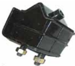
Soporte Motor Agrale (Lado Polea) (idem Art. 962)