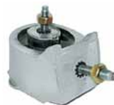
R 21 Soporte de Motor R-21 Lado Izquierdo (7700769719)