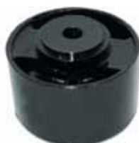
405 Soporte Buje Central Peugeot 405 (1807470)