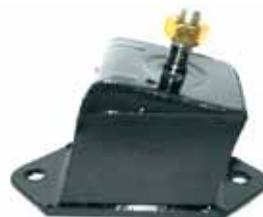
R 9 / R 11 Soporte Del. Der. Motor (7704001319)