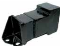
Amortiguador de Vibración Caja izquierdo Diesel Todos - Alto (9991043)