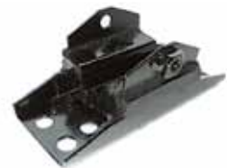
Soporte de Caja Ford C/ Perkins 250/350 (BADI056068A)