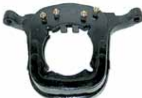
Soporte Tras. Motor S 80 Diesel Fundición Nodular (1843-621)