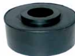
Repuesto Goma Sola Art 931 diámetro 80 mm Altura 39 mm diám. Agujero 29mm