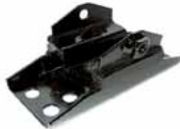
Soporte Caja Veloc. F-100 4x4 (BAE7TZ6068A)