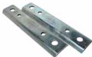
ESTANCIERA Chapa de Repuesto para Art. 801