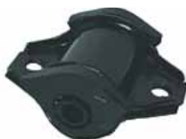
JEEP IKA Soporte de Caja 1964 (3171099)