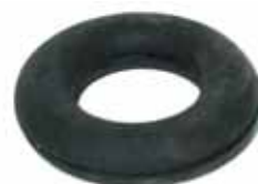
R 18 Aro de Goma para Caño de Escape (7700632015)