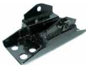
Soporte de Caja F-250 / F-350 Todas F 100 4X4