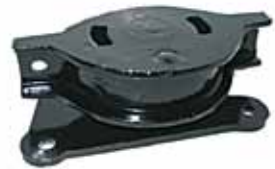
1100 / 128 Soporte de Caja Modelo 1100 Fiat 128 año 71/73 (4204386)