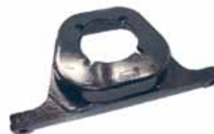
403 Soporte Caja de Velocidades 403 (1843-270)