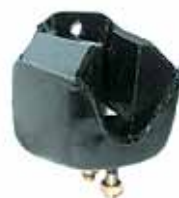
Soporte Delantero Falcon Hasta 1969 (CODD6038F)