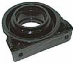
1500 Soporte De Cardán (4060453)