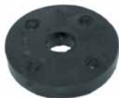
R 12 Manchón de Dirección Dauphine, Gordini, R4, R6 y R12 (6052682)