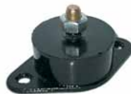
JEEP IKA Soporte Delantero 1962