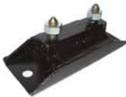
Soporte de Caja de Veloc. F-100 C/ Caja Clark