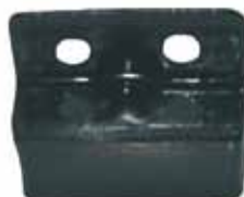
Soporte Delantero Inferior