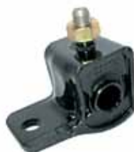
405 Soporte Barra Estabilizadora P-405 (3523540)