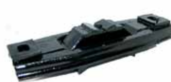
1500 Soporte Trasero (71247954)