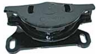
147 GASOLERO Soporte de Caja (4471189)