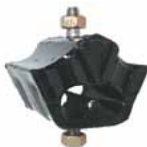
Sop. Del. Motor Gacel/Pasat/Carat/Gol/Saveiro y Senda (823199381)