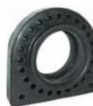
Protector Rul. Cardán 6208 Original (B5QH4827)