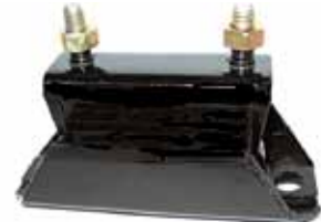
Sop.caja.veloc.Ranger simple y doble Traccion F100 4x4 año 88 al 97 (caja Mazda)