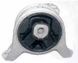
ARTICULO IMPORTADO Soporte de Motor Astra / Corsall / Zafira (90757772)