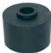
Soporte Sup. Trasero Cabina Camión 66 en Adel. C50/60/70