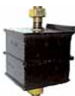
Soporte de Motor F-100 M.W.M. (Ft71199201)