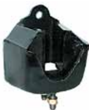
Soporte Delantero Falcon 1970 Hasta 1978 (BAC9DZ6038A)