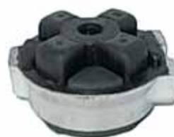
Soporte Caja de Velocidad Ford Galaxy (811399151B)