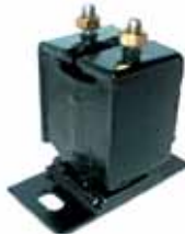
Soporte de Caja Valiant (2265836)