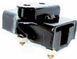
Soporte Caja de Velocidad Ford Falcon 1982 Motor 188 y 221 (BAE2026068A)