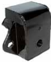
Soporte Tras. Mod. 1965 en Adelante (Idem 1011 Sin T.)