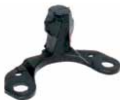
R 19 Tope Soporte Megane