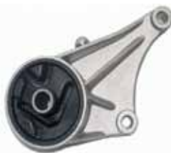
ARTICULO IMPORTADO Soporte Delantero de Motor Astra / Zafira / Meriva (90575186)