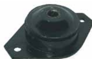
DUNA / UNO Soporte Motor (7563985)