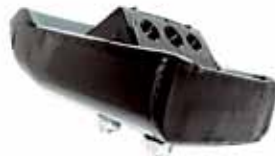
1112 Soporte Trasero 3 Agujeros (3212200217)