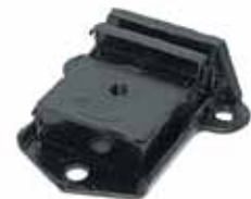
Soporte Delantero Pick-Up 63/65 (3838198)