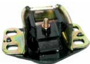
R 19 Soporte de Motor (Derecho) Kangoo (No Hidraulico) (7700434370)