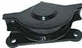
147 NAFTERO Soporte de Caja (4395666)