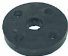
Manchón de Dirección Dodge Todos (71241343)