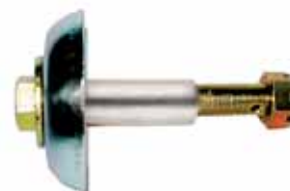
Bulón Completo Para Art. 918 y 1005