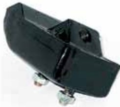
1112 Soporte Delantero 1 Agujero (3122201517)