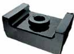
Soporte Trasero Ford con Perkins (CITT6068C)