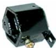
Soporte Trasero Izq. Escort (84AU6B049C)