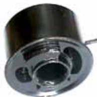
Soporte Trasero de Motor Agrale