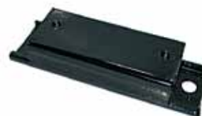
Soporte Trasero Caburé P-63 (P6310300)