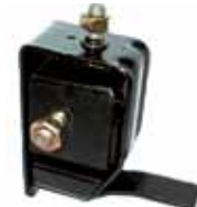
Soporte Motor Trasero Der. Escort 1.6 N°. 86AU6038AA