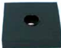
Suplemento Asiento Trav. Del. Sin Cuello