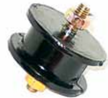
1112 / 1114 Soporte de Radiador (3225044032)