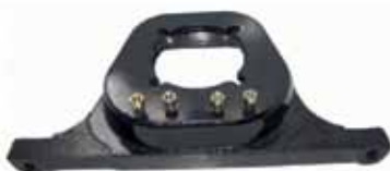
Soporte Caja de Velocidad T.4.B. (1843-11)