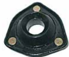
128 Cazoleta de Amort. Fiat 128 Modelo 1100 y 1300 (1039995)