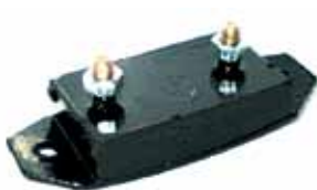
Soporte Trasero de Caja Furgón VW (2113012631)