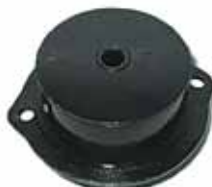
147 DIESEL Soporte de Motor Der. (4471185)