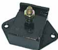
Soporte Delantero Indenor (112015)