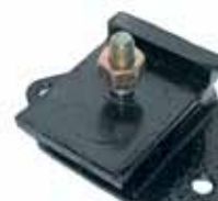
505 Soporte Motor Der. e Izq. 505 Naf. Y Gasol. (1807280)