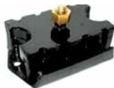
Soporte Delantero Ford F-100 C/Perkins (6DZ6038F)