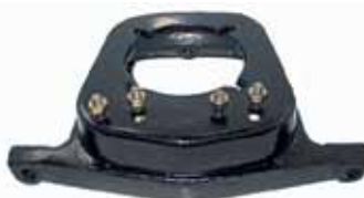
404 / 504 Soporte Caja de Velocidad 404/504 Gasol. (1843-261)