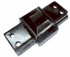
Sop Del de Motor Derecho F100 Motor MWM Modelo 99 en adelante