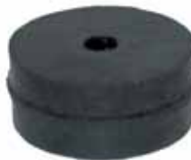
Soporte Delantero 1955