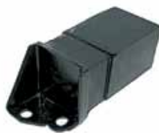
404 / 504 Amortiguador de Vibración Corto Caja Der. Peugeot 404/504 (1874010)