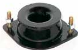
R 19 Soporte Superior de Motor Clio Naftero (7700795689)