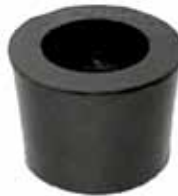
Soporte Inferior de Cabina Mod. F-7000 y F-14000 (EOHT06000155-AB)