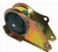
DUCATO Soporte Caja de Veloc. (76639999)