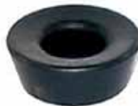
1112 / 1114 Soporte Inferior de Cabina