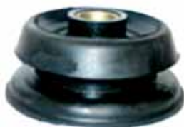
SPRINTER Soporte superior Amortiguador (cazoleta) (9013231185)