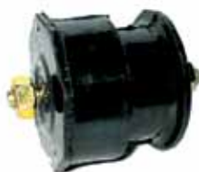
Soporte Delantero de Motor Opel K180 (2639324)