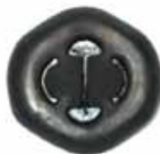
GOL - GOLF Soporte Caño de Escape