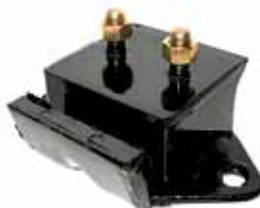
Soporte Lateral S/Aguj. Y 2 Torn. Perkins