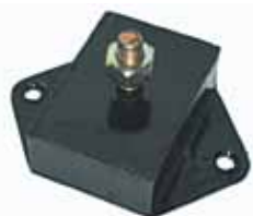
Soporte Indenor 6 Cilindros