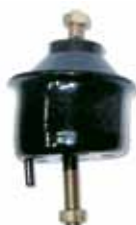
Soporte de Motor Derecho Transit Diesel (95BV6038BF)