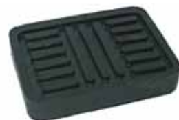
Cubre Pedal Freno y Embrague