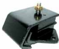
TRAFIC Soporte Delantero de Motor Trafic Naf. Y Gas. 1993 (7700745290)