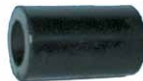
Manguito Palanca de Cambios