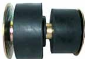
Montante Completo Cabina Delantero Mod. 73/81 (D3TZ1000396B)