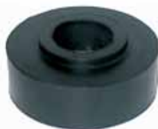
Repuesto Goma Sola Art 930 diámetro 63mm Altura 25mm diám. Agujero 25mm