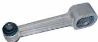
R 19 Soporte Motor Trasero Central Megane Clio II K4m (8200171178)