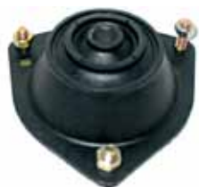
1500 Cazoleta Amortiguador sin Rulemán (4125054)