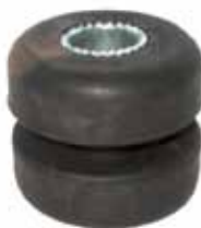
Buje Tensor Ford Falcon 1983 en Adelante