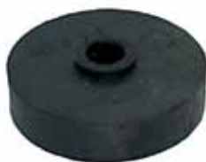
ESTANCIERA Espaciador de Carrocería (673953)