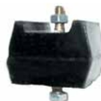
R 12 Soporte Trasero (7700506311)