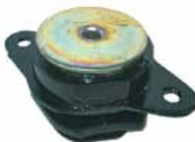
DUNA / WEEKEND 1.7 Soporte de Motor Delantero Der. e Izq (7587674)