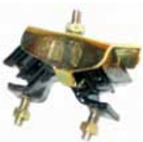
R 19 Soporte Motor R-19 Der. Idem Art 1102 (7700785949)