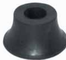
Soporte Inf. Delantero Cabina Pick-Up 67/73 (3948406)