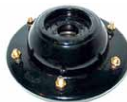
TRAFIC Cazoleta Trafic (7700734718)