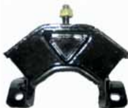
R 9 / R 11 Soporte Trasero Central Motor (7700760510)