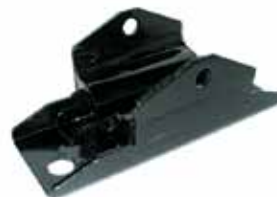
Soporte Caja Ford F-100 1969 2º Serie (BAC6TZ6068A)