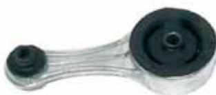
R 19 Soporte Motor Lado Caja Express - Clio Diesel (Recto de 40 mm)