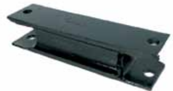
D-100 / D-200 Soporte Delantero (D15272)