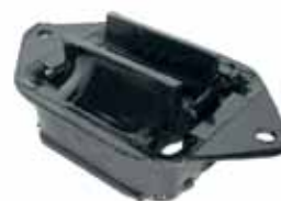
Soporte de Caja Ford Taunus 2.0 y 2.3 (74B126068A)