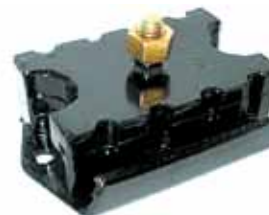
Soporte Delantero Perkins (BAD0DZ6038A) (6D26038F)