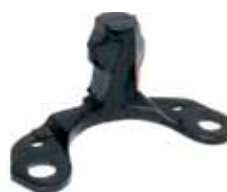
R 19 Tope Soporte Motor Clio - Express Diesel Todos los Modelos