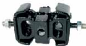
R 18 Soporte del. Inf. Motor R-18 2000 Nafta y Diesel (7704000829)