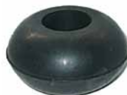
Bocha de Suspensión