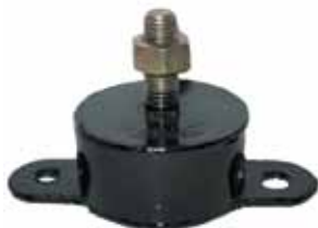
Soporte Delantero (2055340)