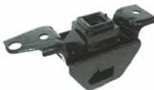
PALIO / SIENA NAFTERO Soporte Motor Delantero (46439600)