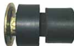
Montante Completo Cabina Trompa 81 en Adelante (C7TZ8100154)