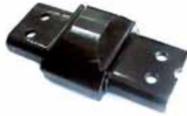
Sop Del de Motor Izq F100 Motor MWM Modelo 99 en adelante