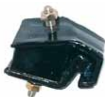
R 19 Soporte Motor Delantero Izq. Clio - Megane 1.6 - R-19 (7700801543)