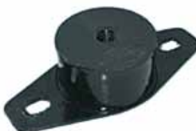
Soporte Delantero Caburé P-63 Reforma