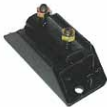
Sop. Caja de veloc. Modelo F100 motor 4.9 Naf. Inyeccion (E7TZ-6068-D)