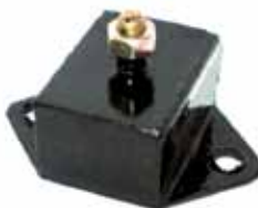
Soporte Caño de Escape (921607)