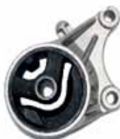
ARTICULO IMPORTADO Sop Delantero de Motor Astra 2.0 16v / Zafira (90575190)