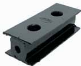
Almohadilla Inf. Soporte Radiador Camión (3897667)