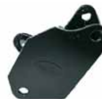
DAUPHINE Y GORDINI Soporte Lat. Derecho (8300016)