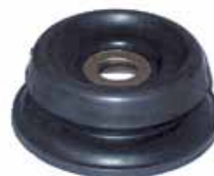
SPRINTER Soporte superior amortiguador(cazoleta) (9013230085)