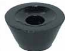
Soporte Trasero Cabina Pick-Up 67/73 (6262168)