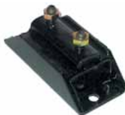
Sop. Caja de Velocidades F100 con Motor Cummins (6068-BA)