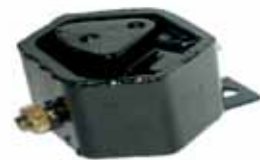
Soporte Motor Delantero Escort (84AU6B032C)