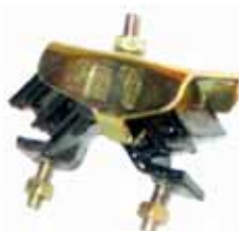
R 19 Soporte Del. Motor Naftero Der. Clio - Megane 1.6 - Kangoo Naf. (7700785949)