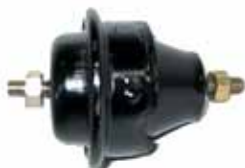
405 Soporte Delantero Derecho Peugeot 405 (No Hidráulico) (1843730)