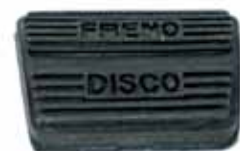
400 Cubre Pedal Freno y Embrague (3122911082)