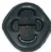
GACEL Soporte Silenciador (823253147A)