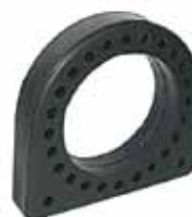
Protector Rulemán Cardán 6208 Ref.