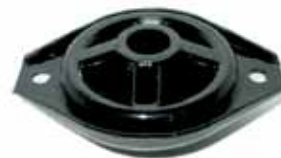
Soporte Trasero de Motor Opel K180 (8977805)