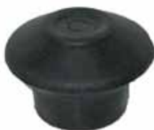
Tope Delantero de Motor Gacel, Saveiro y Senda (823199339A)