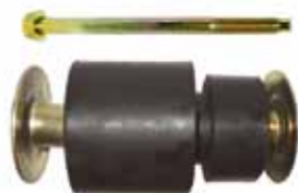
Montante Completo Cabina Tras. 81 en Adelante