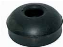
600 Soporte Delantero Inferior (878165)