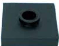
Suplemento Asiento Trav. Del. Con Cuello