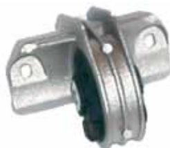
R 19 Soporte Trasero Motor R-19 (7700804163)