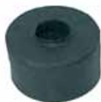
ESTANCIERA Buje Chico Repuesto de Art. 800/801/812 (2004826)