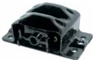
Soporte Delantero de Motor Pick-Up 74 en Adelante (6262208)