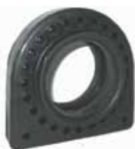
Protector Ruleman Cardán 6208 Orig.