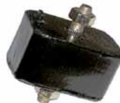
Soporte Trasero de Motor Fiesta Naftero (6194624)