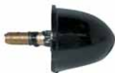
Tope Rebote Delantero