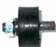
Soporte Radiador Gacel Grande (OZBA121273)