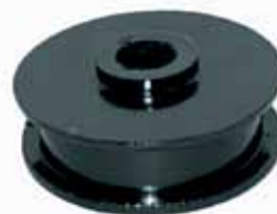
Soporte Cabina Camión Chevrolet 350 Mod. 69/70