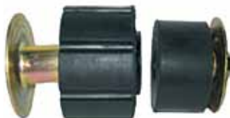
Montante Completo Cabina Trasero Mod. 73/81 (D3TZ1000396A)