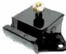
Soporte Lateral S/ Aguj. Y 1 Bulón