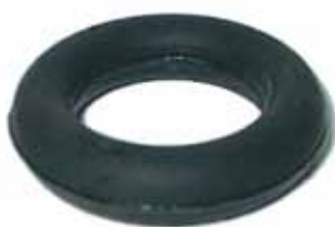
UNO / 147 Aro de Goma Caño de Escape