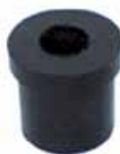
Buje de Elástico Grande