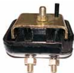
Soporte de Motor delantero Izquierdo Ranger 2.5 Diesel (787R6038A)