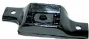
Soporte Trasero Falcon (CIDZ6068A)