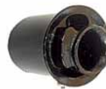
Soporte Trasero de Motor Cargo 915 Cummins Diesel (199381)