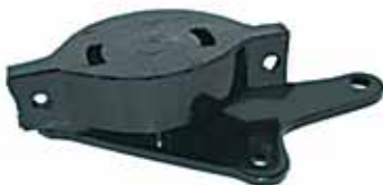
1500 SUPER EUROPA Soporte de Caja C/Rosca (97053070)