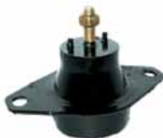
R 19 Soporte Delantero de Motor (Der.) (No Hidráulico) Modelo R-19 Diesel (7700802927)