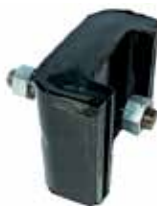
D-400 Soporte Trasero (2230368)