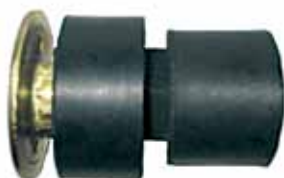
Montante Completo Cabina Tras. 81 en Adelante (D5UZ1000155A)