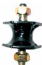
R 12 Soporte Caño Escape R-12 (7702020566)