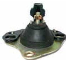
R 19 Soporte Motor 2000 - Derecho Megane (No Hidraulico) (7700818994)