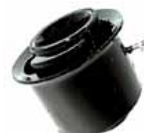
Soporte Tras. de Motor (Lado Caja de Veloc.) Mod. F-14000 C/ Motor M.W.M. (TEG199381B) (E5HT6068FA)