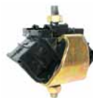
R 18 Soporte Caja Velocidad R-18 y Fuego (7704000777)