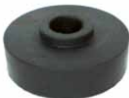
Espaciador de Carrocería Ford F-100 (80 mm.)