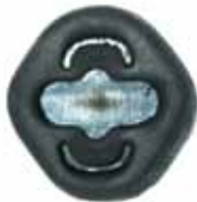
GACEL Soporte caño de Escape (817253147)