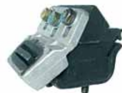
1517 Soporte Delantero Motor H.P.N. (392.240.7017)