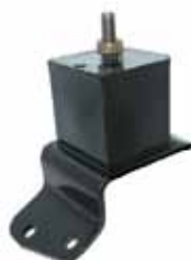
R 18 Soporte Del. Izq. Motor R-18 2000 Fuego y Diesel (7704000769)