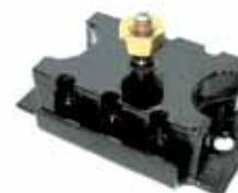
Soporte Del. Fairlane 6 Cil. Y Falcon 1980 (BAD9DZ6038A)