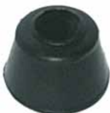
Buje Suspensión Chico