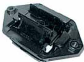
Soporte Caja Ford Sierra (83HF6068A1C)