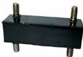
D-100 / D-400 Soporte Del. Y Tras. 1961/62 (1938405)