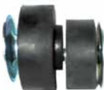
Soporte de Carroc. Pick Up 1961/73 (Arm. C/ Chapas) (C5TZ8100155A)