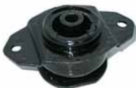
147 DIESEL Soporte de Motor Izq. (5983379)