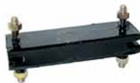
D-100 / D-400 Soporte Delantero 1960