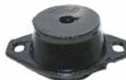
405 Soporte Delantero - Izquierdo Peugeot 405 (1843950)