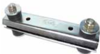
Soporte de Caja Reforma (Arm. Con Chapas) Estanciera, Jeep y Gladiator (2005268)