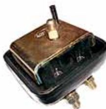
Soporte de Motor delantero Derecho Ranger 2.5 Diesel (YL546038AA)