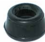
Buje Suspensión Grande