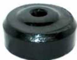
Suplemento Soporte Tras. Ford C/ Perkins