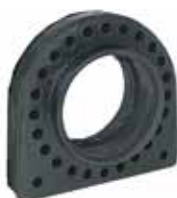
Protector Rulemán Cardán 6208 Orig.