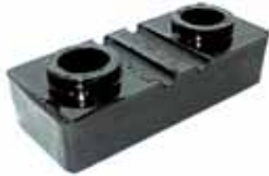
Soporte Superior de Cabina Mod. F-7000 y F-14000 (EOHZ-6000154-A)