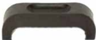
Almohadilla Montaje Radiador Camión y Pick-Up (3889073)