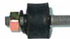
Soporte Radiador Gacel Chico (ZBA121275)