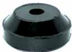
Soporte Superior Del. y Tras. 1946