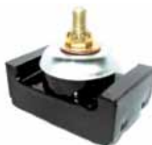
Soporte Tras. Conj. Armado Ford C/Perkins(CITT6068C) (DEUTZ03072046)