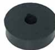
Soporte Inf. Bajo Cabina Camión y D-100