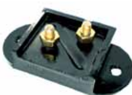
Soporte Delantero de Caja Furgón VW (2113012651)