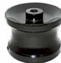
Soporte Delantero de Motor F-14000 con Motor M.W.M. (T72199201)