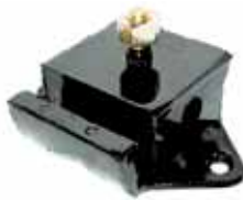
Soporte Lateral C/ Aguj. Perkins Potenciado Y 1 Bulón (L0908)