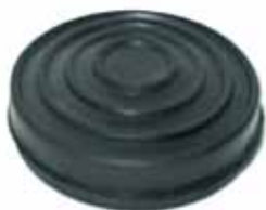
Cubre Pedal Acelerador