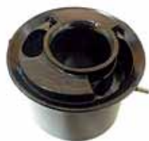
Soporte Trasero de Motor (lado caja) F4000, F14000 Serie10 Motor MWM (TJG199381)