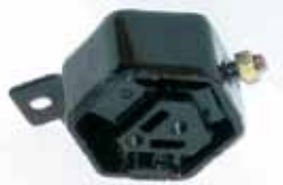
Soporte Motor Tras. Izq. Escort 1.8 (90ABU6B049AA)