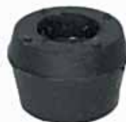
Buje Cónico Universal