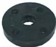
Manchón de Dirección Rastrojero 69