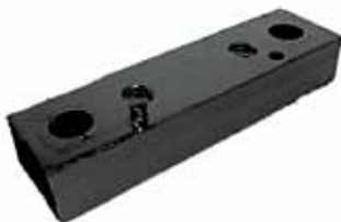
Soporte Delantero Central de Motor Modelo F-14000 C/ Motor M.W.M (TJG199201B)