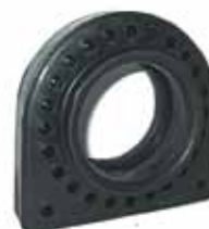
Protector Rul. Cardán 6208 Original