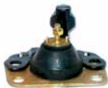
R 19 Soporte Motor Derecho (No Hidraulico) Clio (7700818994)