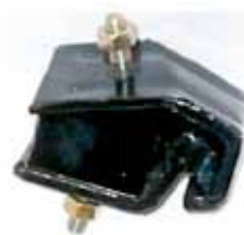
R 19 Soporte Motor R -19 Izq. Idem Art 1101 (7700565762)