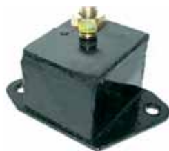
TRAFIC Soporte Delantero Motor 1400 (7700697878)