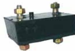
Soporte Delantero Magnete (921710)