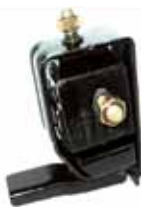
Soporte Motor Trasero Derecho Escort 1.8 (90AU6068BA)