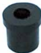
Buje Tensor Caja de Velocidad