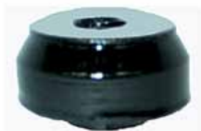
Aislador Inferior Soporte Tras. Falcon (CIDZ6A061A)