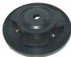
404 / 504 Soporte Superior Amortiguador (521007)