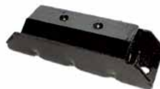
Soporte de Caja de Velocidad D-10 D y D-20 Todas (52269630)