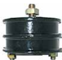
1500 Soporte Delantero (A4066936)