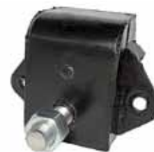
Soporte Trasero 1965 en Adel. C/Bul. Slant Six D 100, D 200, DP 200 y D 400