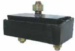
D-100 / D-400 Soporte Delan. C/Motor Valiant (2264675)