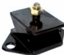
Soporte Trasero (921800)