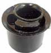
Soporte Trasero de Motor Cargo 915 con Motor MWM año 2000 en adelante. (2-SK/199381/1)