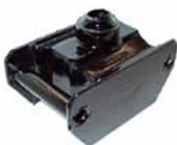
C-350 Soporte Trasero 57/76 Año 62>> (6328287)