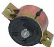
SPRINTER Soporte de caja (A6902417113)