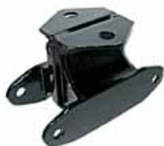
1100 Soporte Caja de Velocidad