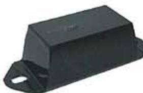
ESTANCIERA Taco de Suspensión Tras. (908838)