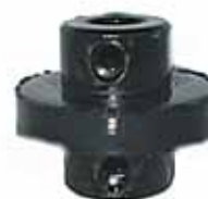
600 Manchon Palanca de Cambio (875546)