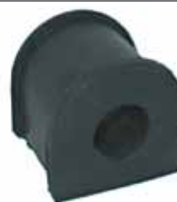
1100 Buje Inf. Barra Estabilizadora