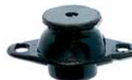
R 19 Soporte Del. Izq. Motor 2000 (Megane) y R-19 Diesel (7700788318)