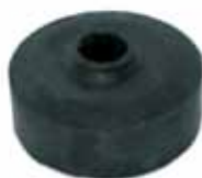
JEEP IKA Buje Amort. Superior (3156228)