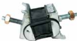
R 21 Soporte Trasero Motor (7700766126)