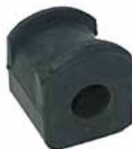
1100 Buje Ext. Barra Estabilizadora