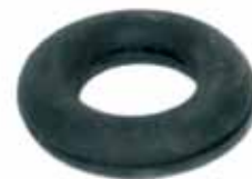
GOL - GOLF Anillo Caño de Escape Silenc.