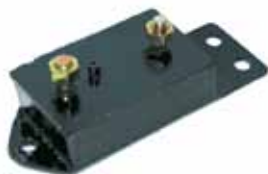
Soporte Delantero Superior (921801)