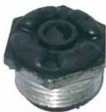
DUNA / UNO Soporte Amort. Tras. Fiat Duna-Uno (94>>) (7635228)