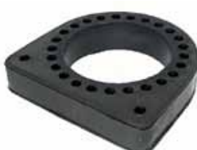
Protector Rul. Cardán 6208 Reforma