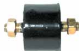
JEEP IKA Soporte Caño de Escape Rosca 5/16" Sae (639024)