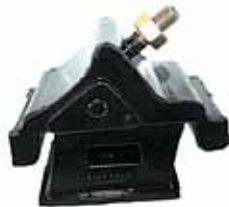
Soporte Del. Motor F-100 Diesel Maxion (96TU6038AA)