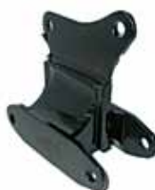
1500 Soporte Trasero (4060117)