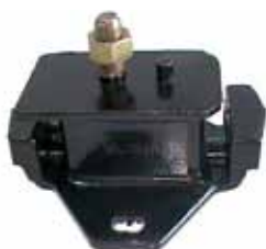
Soporte de Motor Hilux 5l (12361-54121)