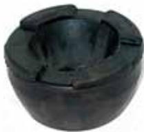
1112 / 1114 Soporte Superior de Cabina (3228910101)