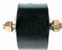
Soporte Delantero Ford Taunus 2.0 y 2.3 (7413126038A)