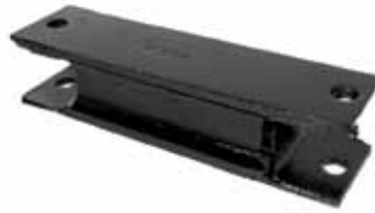
Soporte Delantero Motor Perkins (D15272)