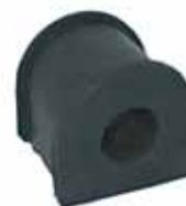
1500 Buje Barra Estabilizadora (4094241)